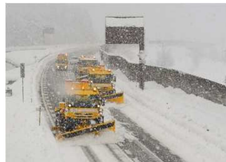
しおざわいしうち むいかまち 関越自動車道 塩沢石打IC～六日町IC付近