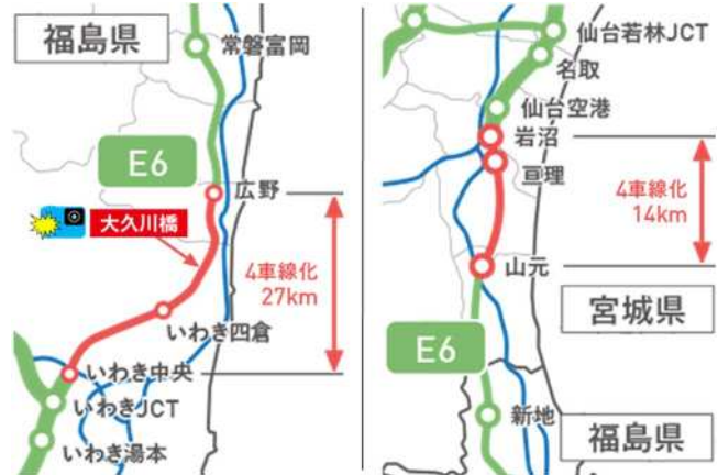
常磐自動車道4車線化工事区間