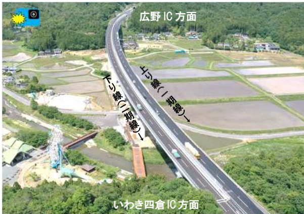
おおひさがわばし 大久川橋付近

復興創生期間内の概ね5年での完成を目指し、平成28年より事業を進めていた常磐自動車道・仙台東部道路の4車線化工事(いわき中央IC～広野IC間の約27km 及び山元IC～岩沼IC間の約14km)のうち、令和3年6月には残りの区間(約4km)も完成し、4車線運用を開始しました。