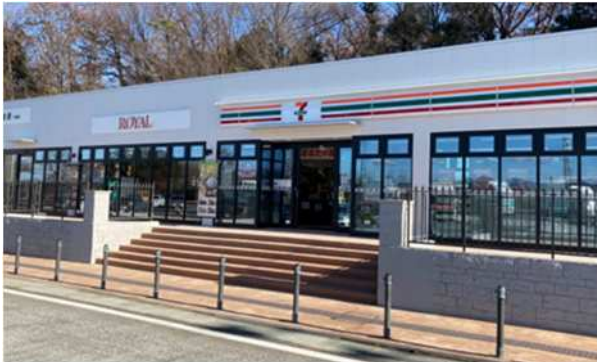
よりの 寄居PA(上り線)

お客さまへのサービス・利便性の向上のため、令和3年度に21店舗でSA・PAの改修工事を実施しました。また、お客さまからのご要望を受け、各主要路線を中心にシャワー設備(24時間営業)を新たに6店舗整備しました。